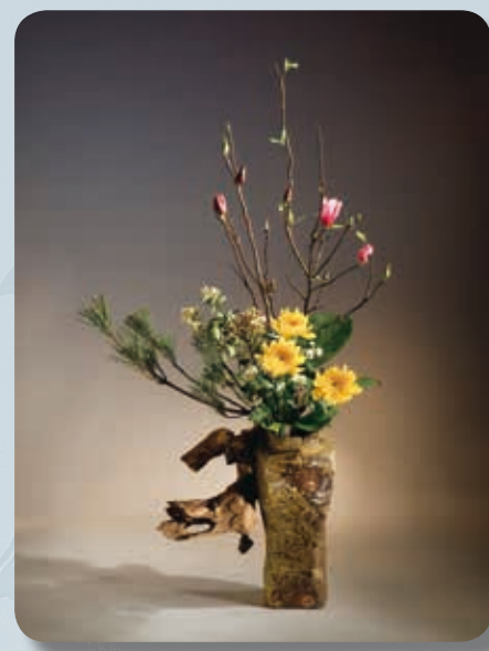
花材：辛夷、菊花、松、石斑木、電信葉、小菊 花器：陶瓶