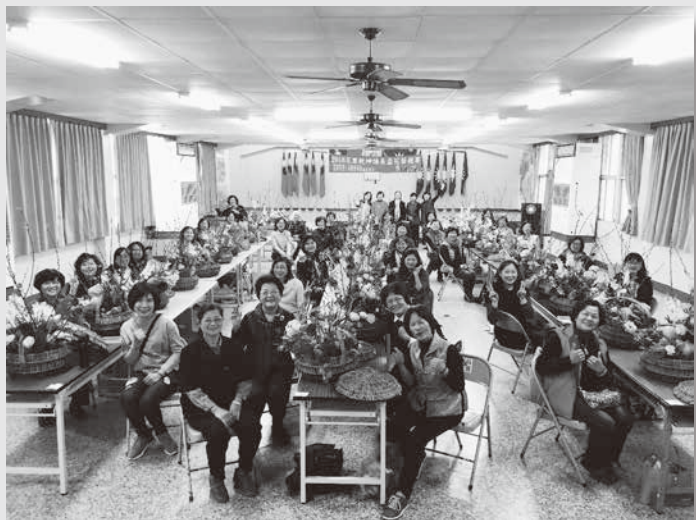
40名參賽者全力展現自己的技藝

花蓮縣洄瀾插花協會與花蓮市中華花藝協會聯合於3月11日在花蓮縣黨部會議室舉辦107年「花果乾坤」議長盃花藝競賽，40名參賽者以在地特色蔬果結合插花，現場一片花團錦簇，作品皆美不勝收。