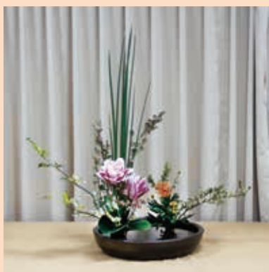
研一盤花—左右兩側雙點插