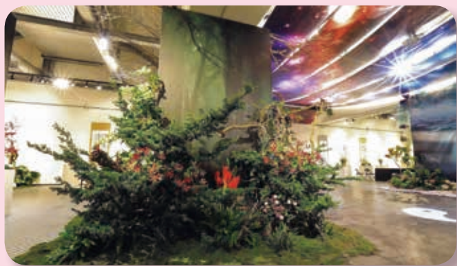
花現乾坤大作一隅

據《易經》所述，「一陰一陽之謂道」，宇宙萬物始於陰陽，是以伏羲氏製作成太極圖，並以「太極生兩儀，兩儀生四象，四象生八卦」製作出八卦圖。今年新竹縣花協即以「花現乾坤」作為大展的主題，並以太極、卦圖作為主要意象。