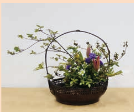
高研一—籃花同側二點插