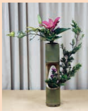
研二—雙隔筒花主上隔