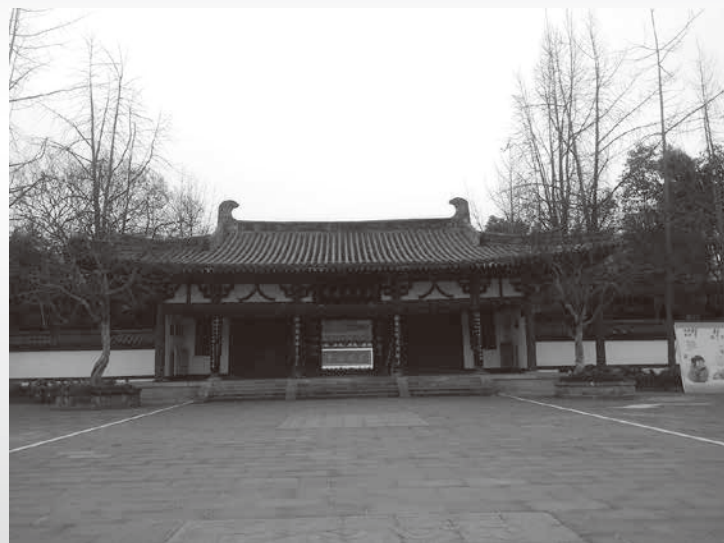
四川省江油市李白紀念館，維基百科

孔子說：「不學詩，無以言」、「溫柔敦厚，詩教也。」吟唱之餘，心情與詩情一同起伏，於是有創作心象花的情緒。