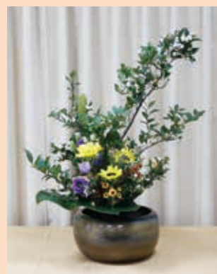
研三一缸花直立基本型