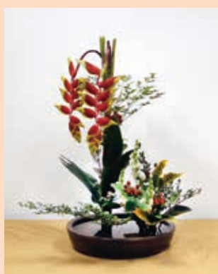
高研一—高兀體—直立傾斜綜合型之表現