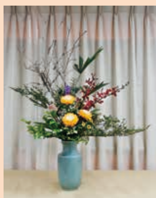
高研一—十全插盤主體