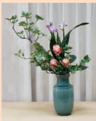
研二—瓶花多種插傾斜型