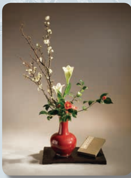
花材：梨花、百合、茶花 花器：天球瓶

數千年來，中華民族以農立國，人與植物有極其密切的依存關係，而且隨著時代演進變遷，賦與植物豐富獨特的文化意涵，成為中華文化特色之一。